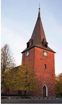
Evangelisch-Lutherische Kirchengemeinde Lütjenburg